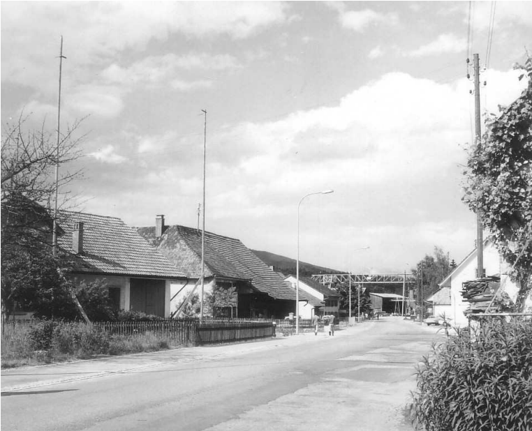
Die Mittelgäustrasse von Westen her betrachtet. Man beachte links im Bild die Bauprofile der späteren Siedlung der Wohnbaugenossenschaft Sälhof.