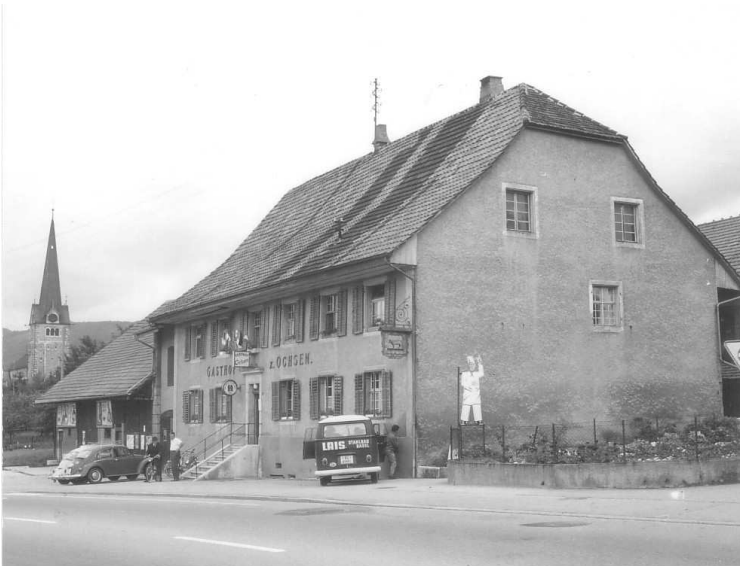
Der geschichtsträchtige Gasthof Ochsen sieht heute auch etwas anders aus