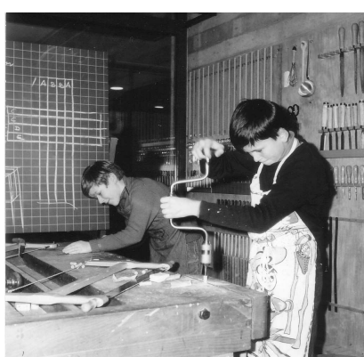
Buben schreinerten Spielsachen