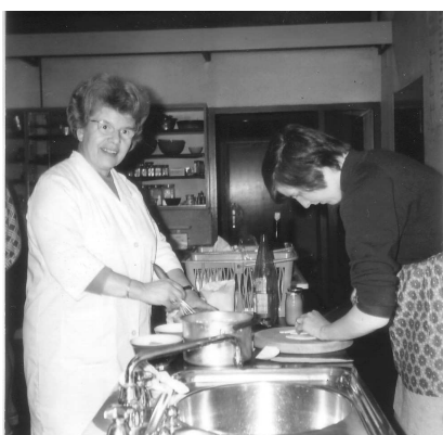
Das schien gut zu werden