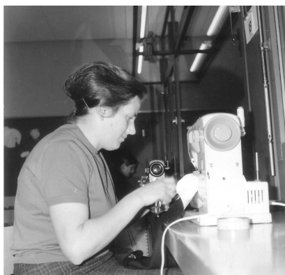
Bubenhosen wurden genäht