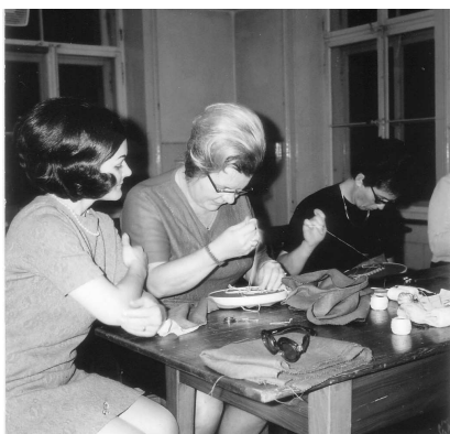
Stickn ist anspruchsvoll

In den 70er-Jahren organisierte die Frauenschulkommission (sie war für die Arbeitsschule, die Kochschule und für die Kindergärten zuständig) jeweils im Herbst eine bunte Palette an Kursen. Diese Kurse erfreuten sich grosser Beliebtheit und waren fast immer ausgebucht. Fachkundige Profis (Köchinnen, Schneiderinnen, Geschäftsleute, Lehrkräfte usw.) opferten ihre Freizeit und weihten mit viel Geschick und Einfühlungsvermögen die Kursteilnehmer in ihre Künste ein.