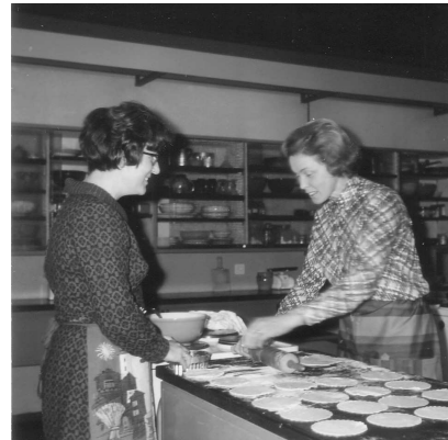
Leckerles wurde gebacken