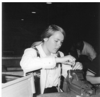
Schmuckstücke aus Metall