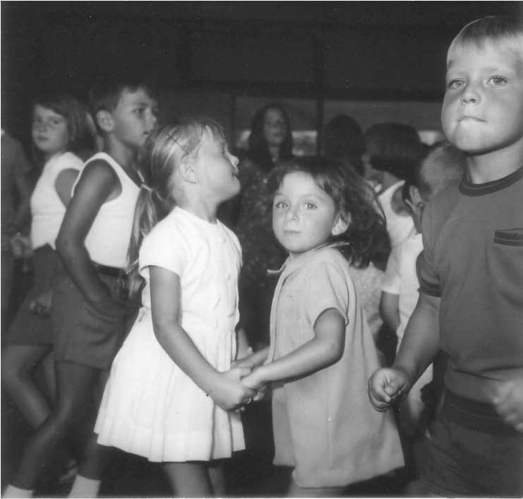
Keines zu klein ein Tänzer oder eine Tänzerin zu sein.