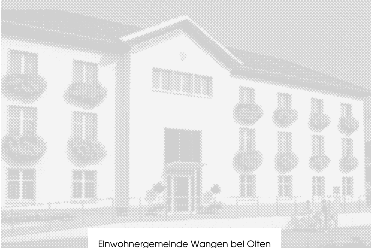
Einwohnergemeinde Wangen bei Olten